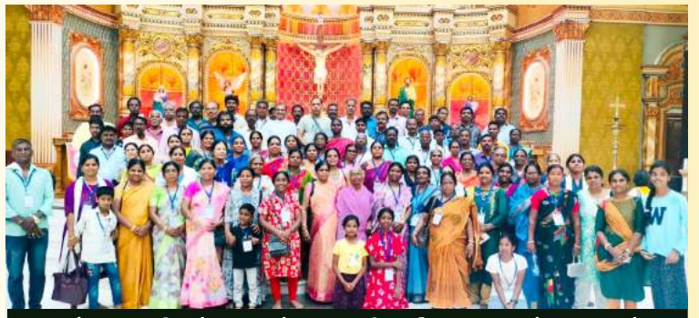
தவக்கால திருப்பயணம் - புனித தேவசகாயம் ஆலயம் மற்றும் திருவனந்தபுரம் ஆலயங்கள்