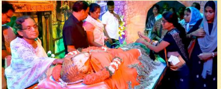
எனக்காக இறைவா எனக்காக, இடர்பட வந்தீர் எனக்காக!