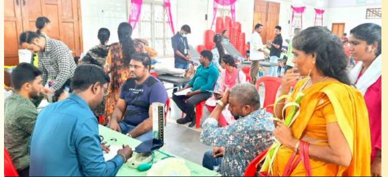
நமது பங்கின் இளையோரின் முயற்சியில் குருதிக் கொடை