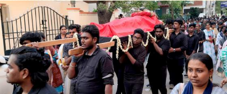
இன்னுயிர் அகன்றது உமை விட்டு, பூமி இருளில் ஆழ்ந்தது ஒளி கெட்டு!