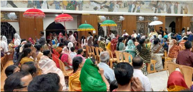
நற்கருணை இடமாற்ற திருப்பவனி