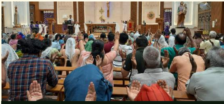
மாதா தொலைக்காட்சி அருட்தந்தையர்கள் வழி நடத்திய தவக்கால தியானம்