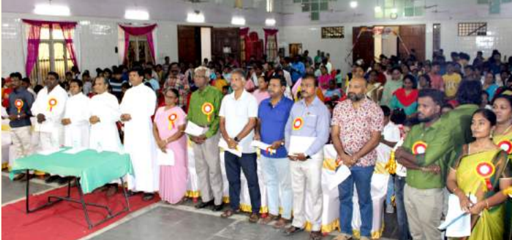
மறைக்கல்வி ஆண்டுவிழா 2024