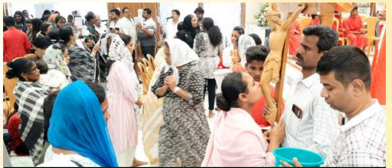
திருச்சிலுவை ஆராதனை நிகழ்வில் பங்குமக்கள் பக்தியோடு கலந்து கொண்டனர்