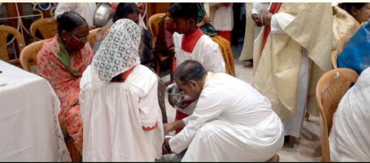
பாதம் கழுவும் சடங்கில் நம் பங்குத்தந்தை