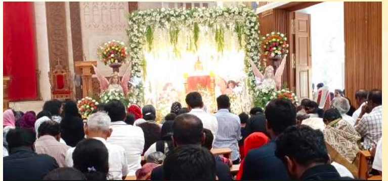
மலர்களும் மனங்களும் இணைந்து நற்கருணை ஆண்டவரை மகிமைப்படுத்திய தருணம்