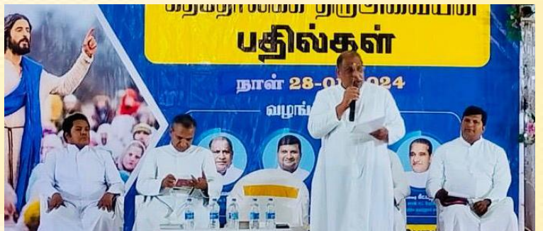
திருஅவையின் கேள்வி பதில்கள் (28.01.2024)