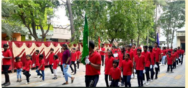
கொடிகளுடன் மறைக்கல்வி பிள்ளைகள்