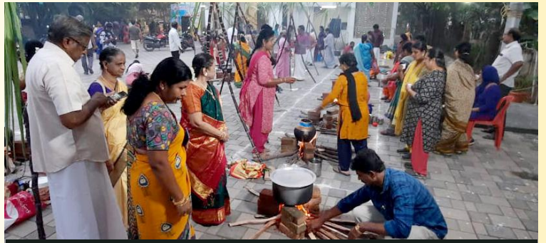
பொங்கலோ பொங்கல் (15.01.2024)