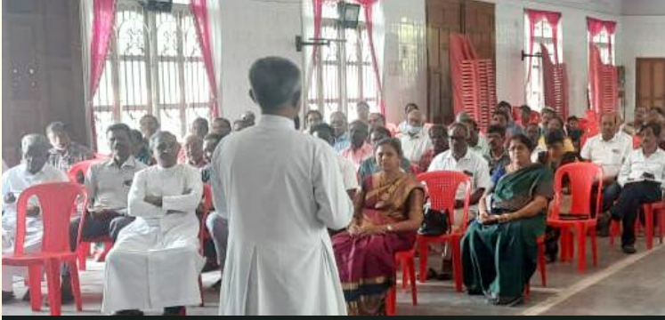
இந்திய அரசியல் சாசனமும் சிறபான்மையினரின் பாதுகாப்பும் குறித்த கருத்தரங்கு (21.01.2024)