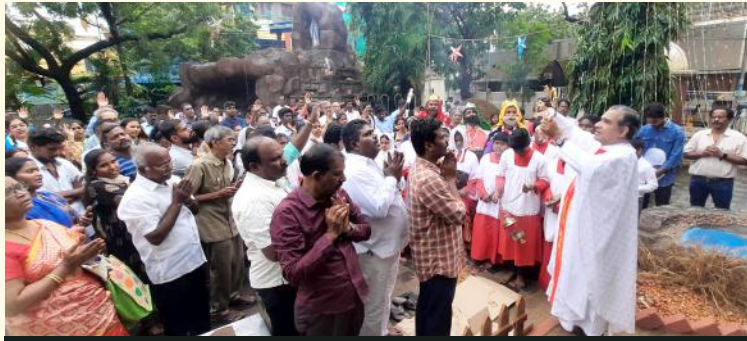
திருக்காட்சி பெருவிழா ஆசியினை பங்குத்தந்தை வழங்கினார் (07.01.2024)