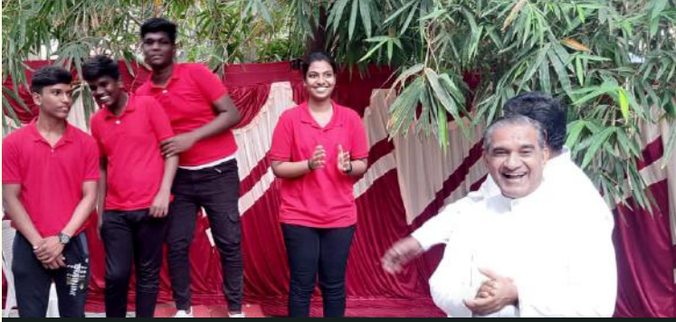
மறைக்கல்வி விளையாட்டு போட்டிகளில் வெற்றி பெற்ற அணிகள் (26.01.2024)