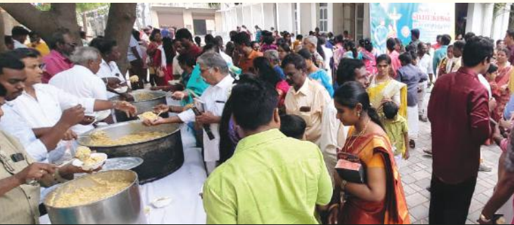
பொங்கலை பகிர்ந்து உண்ட பங்கு மக்கள்