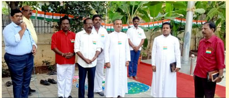
குடியரசு நாள் விழாக் கொண்டாட்டம் (26.01.2024)