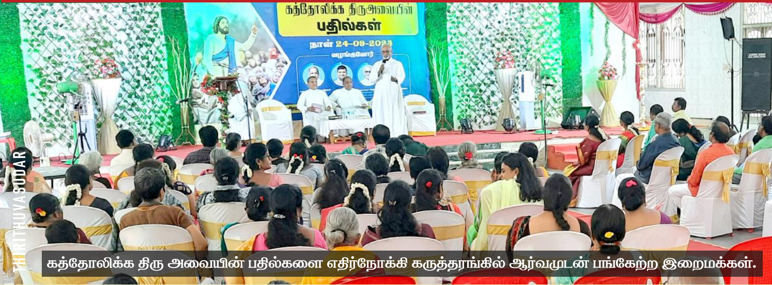
கத்தோலிக்க திரு அவையின் பதில்களை எதிர்நோக்கி கருத்தரங்கில் ஆர்வமுடன் பங்கேற்ற இறைமக்கள்.